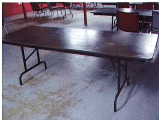
Tables pliantes 6 pieds 10 $