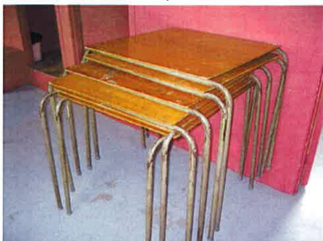
Tables carrées 4' x 4' 7 $