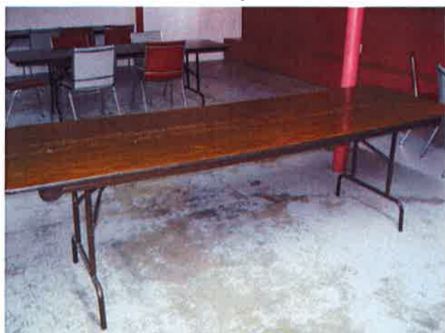
Tables pliantes 8 pieds 15 $